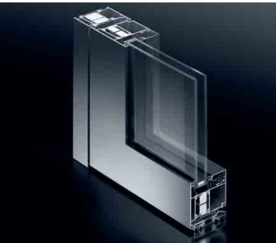
Schüco Tür ADS 75 HD.HI Schüco Door ADS 75 HD.HI